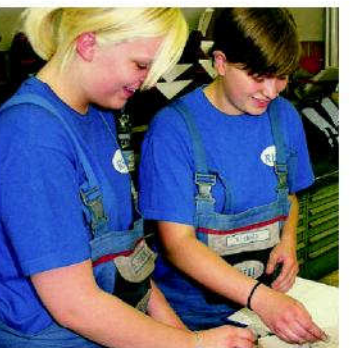
Lehrlinge bei RHI genießen eine der besten Ausbildungen.

Beim Feuerfest-Traditionsbetrieb RHI in Breitenau, Leoben und Veitsch absolvieren aktuell 47 Jugendliche eine Lehre in den Berufen ChemielabortechnikerIn, ElektrobetriebstechnikerIn, MaschinenbautechnikerIn, Industriekaufrau/-mann, PhysikalabortechnikerIn, WerkstoffprüferIn, MechatronikerIn und ProduktionstechnikerIn. Auch heuer werden wieder Lehrlinge aufgenommen. RHI bietet den Lehrlingen eine der besten Ausbildungen in der Industrie sowie ein fachübergreifendes Aus- und Weiterbildungsprogramm bereits ab dem ersten Lehrjahr. Dazu zählen zum Beispiel Einsteigermeetings für alle neuen Lehrlinge, eine Lehrlings-Gesundheitswoche sowie der Lehrlingsaustausch zwischen den Standorten. Besondere Leistungen im Beruf und in der